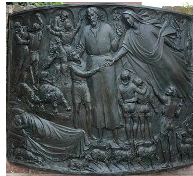
Il sogno di Giovannino dei “nove anni”