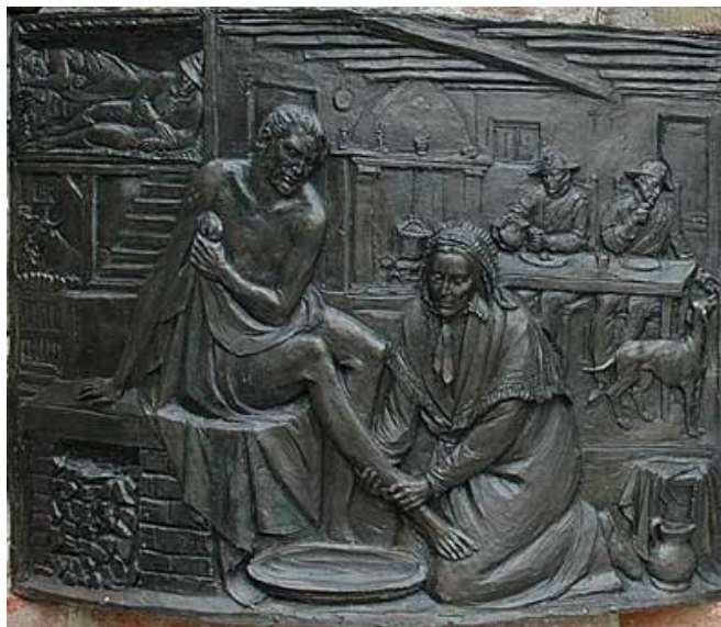
Margherita consolatrice dei malati e dei poveri

Doniamoci al servizio del prossimo con spirito di carità e di gratuità.