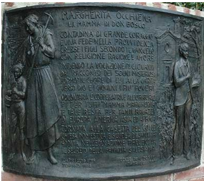
Mamma Margherita che torna dai campi e San Domenico Savio